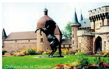
Château de la Clayette